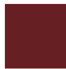
Czerwony baskijski połysk